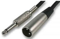
Cable Xlr - Jack

Este conector se crea en 1987. Solo transporta una señal de vídeo. Actualmente ya casi no se utiliza. Video Graphics Array o Matriz de Gráficos de vídeo. la señal que se emite a través de estos cables es analógica. Este conector es sustituido por el DVI. La resolución que soporta son 640 x 480 pixeles. Se usaba mucho para conectar el monitor a la CPU y también para proyectores de vídeo.