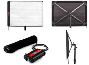
Led Flexible Panel

Panel LED flexible. Es una unidad de 100 vatios de potencia. Tiene más de 500 diodos. La temperatura de color es variable: desde 3200K hasta 5600K. También la podemos usar con baterías o enchufada a la corriente. Trae como accesorio una tela blanca difusora de la luz. Cuenta con una antena, para poder controlar varios paneles al mismo tiempo en forma inalámbrica. La luz que produce es muy suave y difusa.