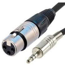
Cable Xlr - Mini Jack

XLR son las siglas en inglés de eXternal Line Return, en español línea de retorno Externa. Es el conector balanceado más utilizado para aplicaciones de audio profesional, y también es el conector estándar usado para transmitir la señal de control DMX.