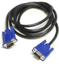
Cable Vídeo Vga